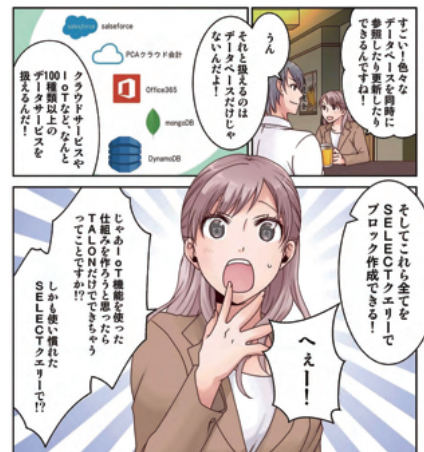
マンガでわかる超高速開発ツール TALON https://www.talon.jp/manga/manga001_web.php